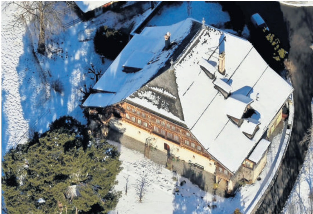
Classé monument historique à l'initiative de la Commune en 1946, le Grand Chalet est reconnu d'importance nationale depuis 1996. CHANTAL DERVEY

C'est sur un petit périmètre autour de la gare, racheté par la Commune en 2009, que devront se concentrer les besoins futurs de la communauté. Un site d'autant plus stratégique qu'il est la porte d'entrée non seulement du village, mais également du Pays-d'Enhaut, pour qui arrive par le train depuis Montreux. «Nous avons établi la liste de nos besoins. Il fallait de nouveaux locaux pour notre voirie, un espace pour le groupement