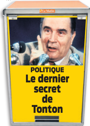
François Mitterrand Ex-président de la France