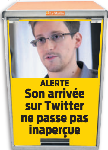
Edward Snowden Informaticien américain